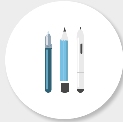
ILLUSTRATION & GRAPHISME